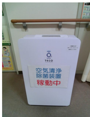
空気清浄除菌装置