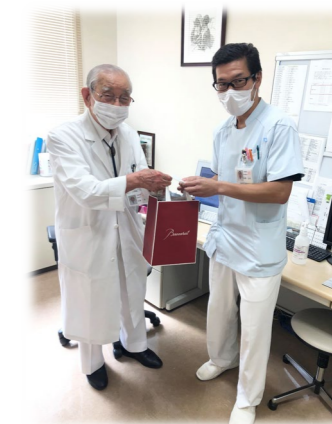
名誉院長より職員一人ひとりに記念品を頂きました。