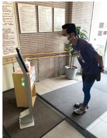
37.5℃以上あると警告ランプが点灯。マスクの着用をしていない方に対しても警告ランプで知らせてくれます。