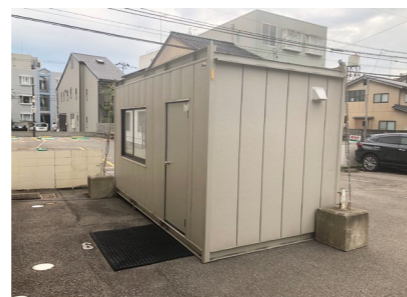
発熱外来専用診察室を設置し、他患者様との接触防止に努めています。