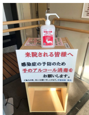
アルコール消毒を増設設置