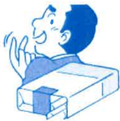
タバコが吸いたい