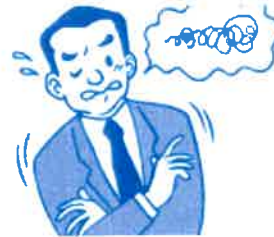
イライラ落ち着かない