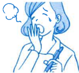
体がだるい・眠い